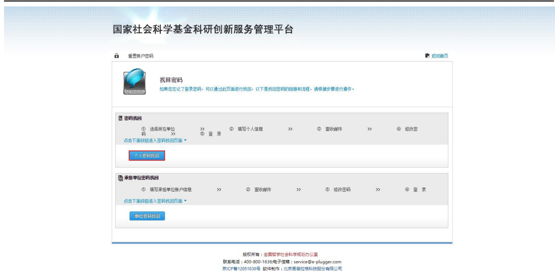
<图片：个人密码找回二>