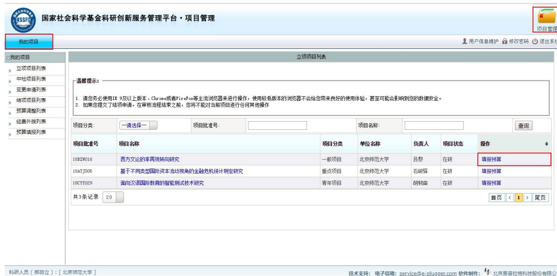
<图片：填报项目预算一>

查询并找到刚填报预算的项目，并在右侧操作栏中点击“提交”的操作，完成预算填报申请。预算信息提交后，不可再进行编辑操作（如您的预算信息已经填写完成，但提交时网页提示您责任单位账户信息或单位联系电话未完善，此时您应该与您所在责任单位科研管理部门工作人员联系，请他以责任单位管理员的账号登录系统并完善责任单位信息，之后您就可以继续提交）。如下图所示。