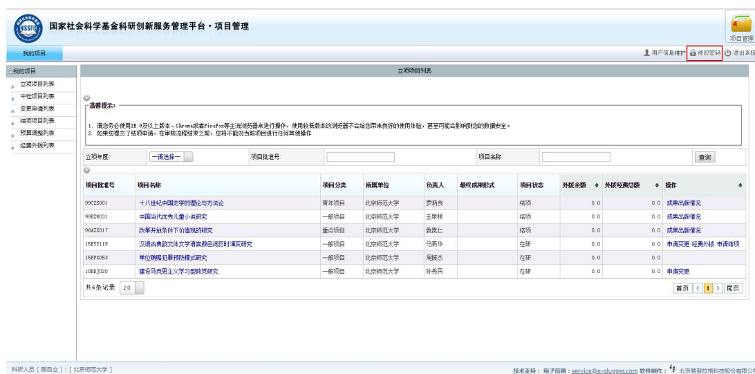
<图片：当前用户密码修改一>

操作步骤：点击右上方的【修改密码】，进入“用户密码修改”页面，修改密码后，点击右上方的【保存】按钮，完成当前用户密码修改，如下图所示。