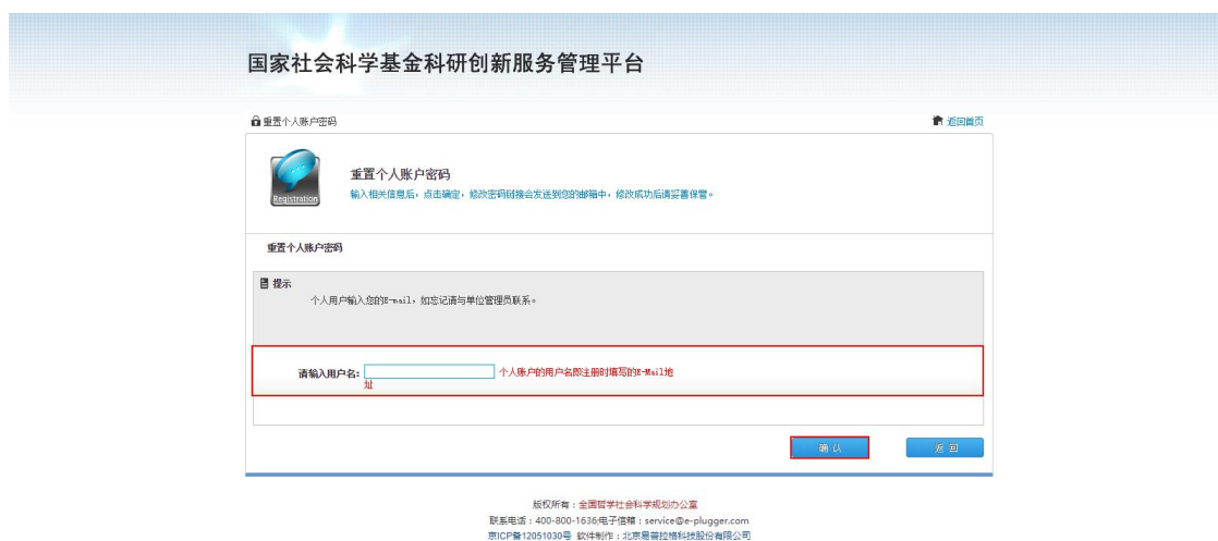
<图片：个人密码找回三>

点击确认后，平台会向您的注册邮箱中发送一封带有重置登录密码连接的邮件，请及时按照邮件中的链接访问重置密码页面，重置您的登录密码。如下图：