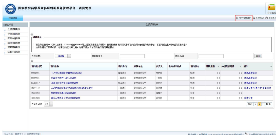
<图片：用户信息维护一>

操作步骤：点击右上角的【用户信息维护】，进入“用户信息编辑”页面，请修改完善相关信息后，点击右上角的【保存】按钮，完成用户信息维护，如下图所示。