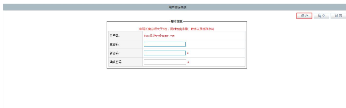
<图片：当前用户密码修改二>